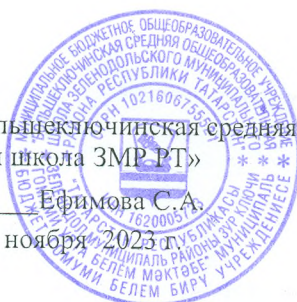
ГРАФИК ОЦЕНОЧНЫХ ПРОЦЕДУР МБОУ «Большеключинская средняя общеобразовательная школа ЗМР РТ» на 2 четверть 2023 – 2024 учебного года